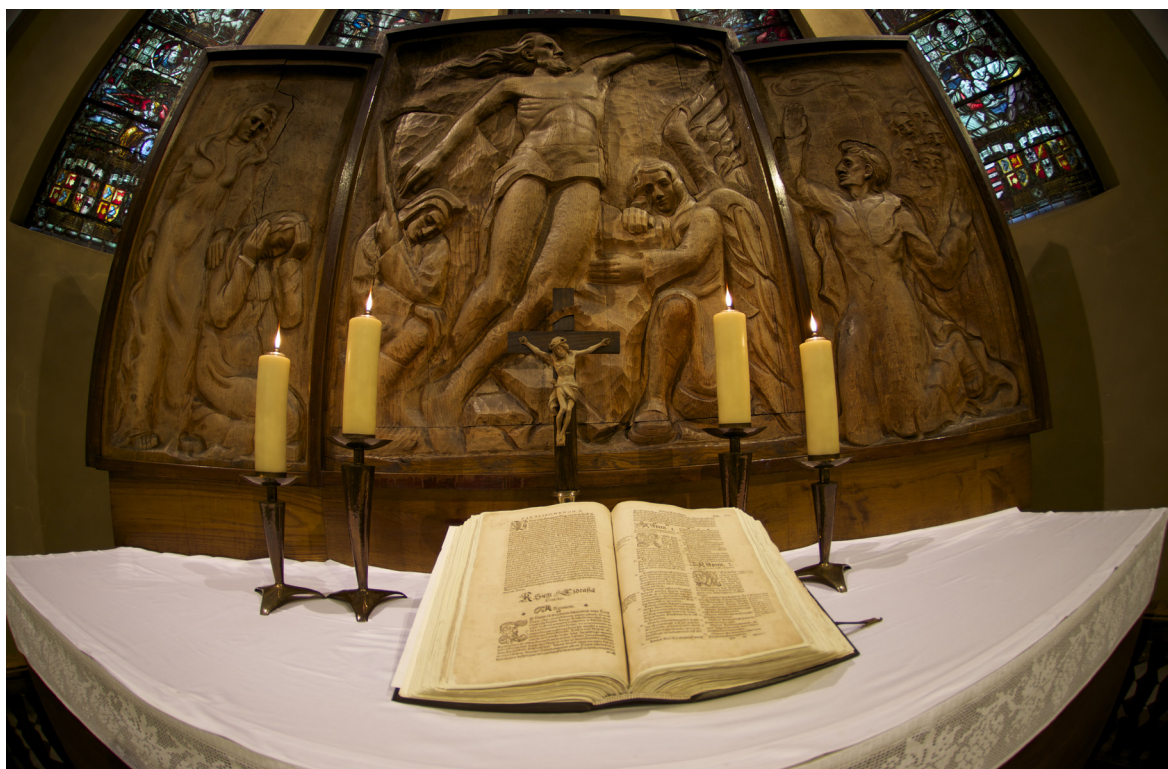
1. Biblia brzeska (Biblia Radziwiłłowska) z 1564 r.