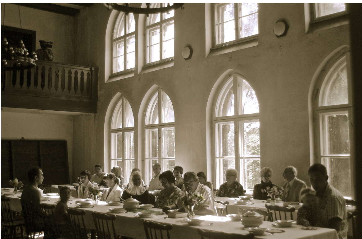
9. „Cisza Syjonu” podczas realizacji filmu Szlakiem Matki Ewy , zamieszczonego także w Wirtualnym Muzeum Ewangelicyzmu Bytomia i Okolic