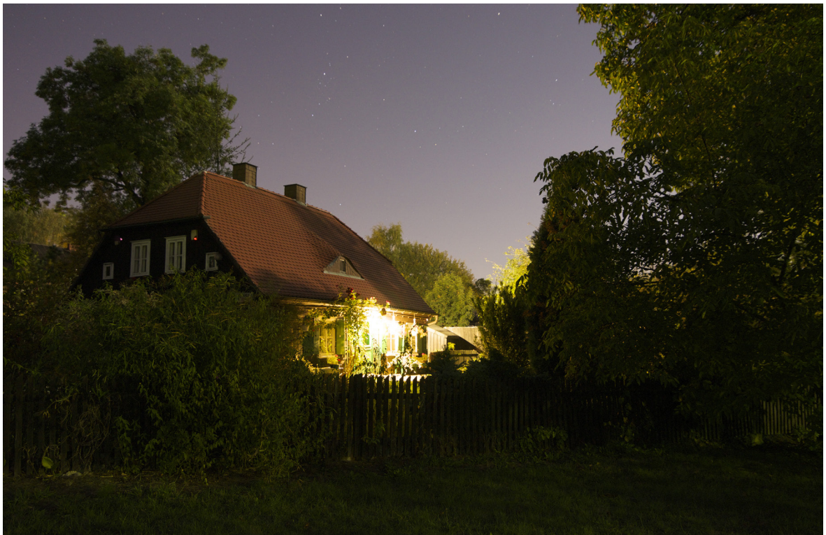
4. Muzeum „Domek Matki Ewy”

3. The Evangelical Church in Bytom-Bobrek after a fire