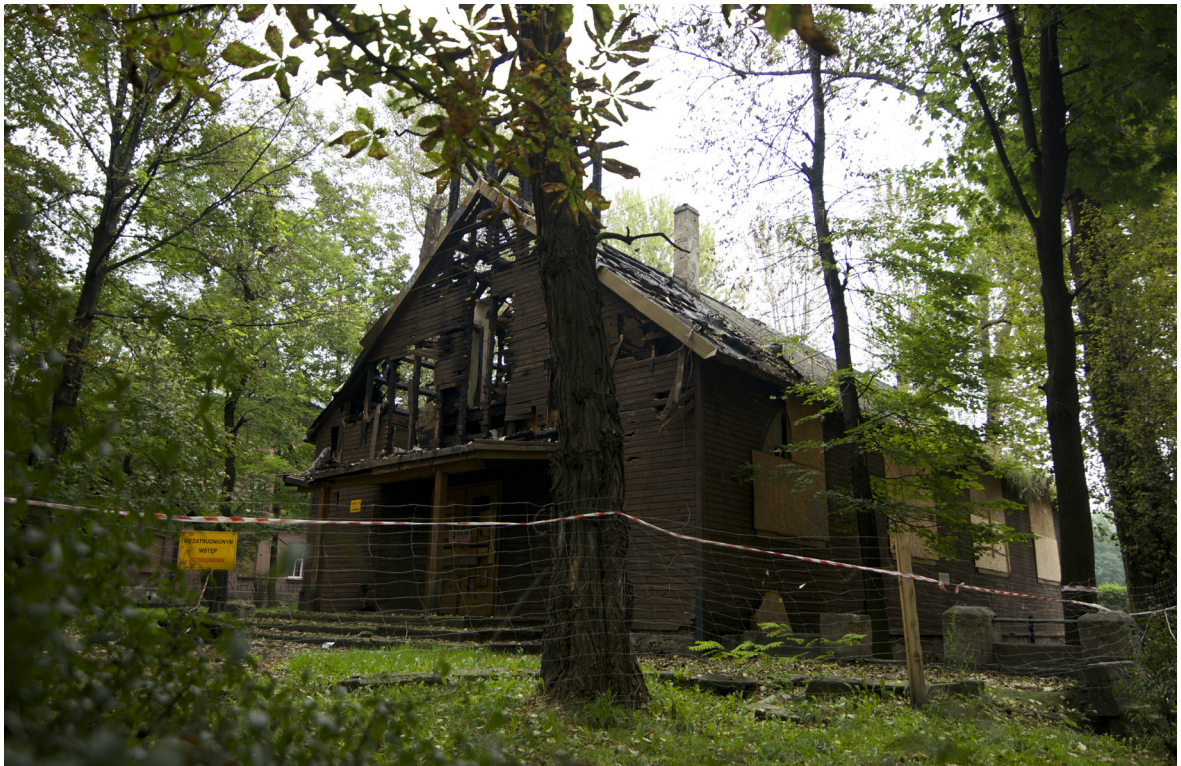
3. Ewangelicki kościół z Bytomia-Bobrka po pożarze

3. The Evangelical Church in Bytom-Bobrek after a fire