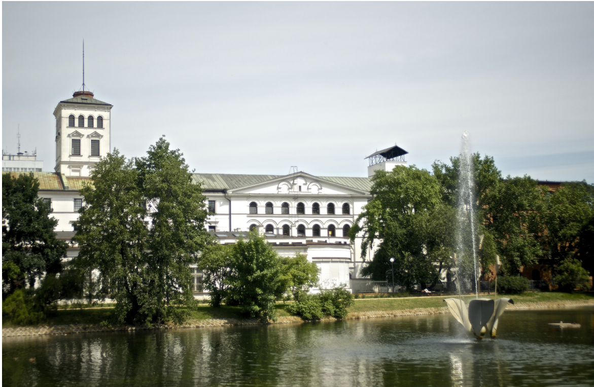
2. Biała Fabryka Geyera w Łodzi