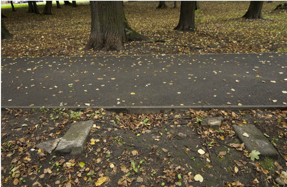
10. Skwer u zbiegu ul. Wrocławskiej i Kolejowej w Bytomiu – dawny cmentarz ewangelicki, fragment mogiły

Wśród ewangelikaliów ważną rolę odgrywają artefakty o charakterze kontrowersyjnym, nawiązujące do czasów kontrreformacji oraz innych okresów prześladowań ewangelików (w tym także ruchomości fizycznie nieistniejące lub mienie zagrabione). Gdy 8 sierpnia 1629 r. na polecenie cesarza Ferdynanda II zaczęto odbierać śląskim ewangelikom kościoły, wierni spotykali się potajemnie w prywatnych domach lub innych odludnych miejscach. Pamiętką po tych trudnych czasach są tzw. leśne kościoły ukryte w beskidzkich lasach 27 . Choć po okresie kontrreformacji sytuacja ewangelików zaczęła się powoli zmieniać, nigdy jednak nie udało się uzyskać